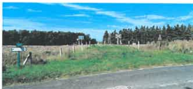
Illustration de la faible distance entre la voie et la rue

La distance entre la voie ferrée et la rue du Villier est réduite à une dizaine de mètres. Cette situation serait potentiellement dangereuse en présence d'un attelage agricole de grande longueur en arrêt en travers de la voie ferrée pour céder le passage à un véhicule circulant sur la rue du Villier. La visibilité autour du passage est dégagée, à l'exception d'une futaie à environ deux cents mètres au Nord du PN (cf photographie du § 1.4.1), mais l'hypothèse d'une collision ne peut être écartée par des trains circulant régulièrement à 100 km/h sur cette portion de voie.