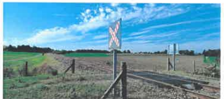
vue en direction du Sud-Ouest