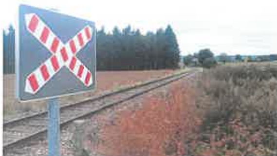
Vue en direction du Nord

Le flanc Est de la voie est occupé par un remblais de cinq à dix mètres de large entre la route du Villier et la voie ferrée. Un champ cultivé est situé à l'ouest du passage à niveau. La zone est peu dense en habitations et la circulation des véhicules est rare.