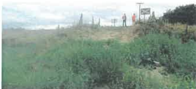
Rampe résiduelle coté champ

La rehausse ou platelage sur les voies est susceptible de provoquer l'immobilisation d'un véhicule de faible garde au sol, et donc, une augmentation du risque de collision avec un train.