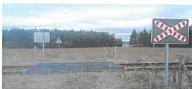
rehausse ou platelage